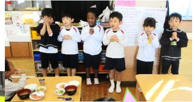
ごはんの前のお祈りをしてくれたよ☆