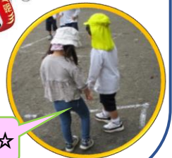
自然と手を繋いでくれたね☆