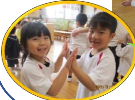
さあ、相手はきみだ!!