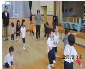
だるまさんがころんだ★