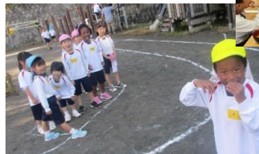
ジャイアンゲーム★