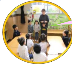
すみれ組さんの紹介☆ ドキドキ♡