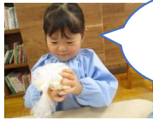
もみもみ 気持ちいい